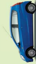
Blau Perleffekt (B58)