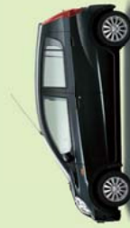
Schwarz Perleffekt (X07)