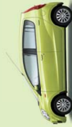
Smaragdgrün Perleffekt (G41)