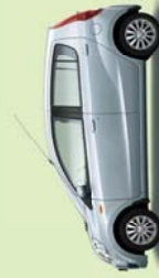
Arktissilber Perleffekt (S28)