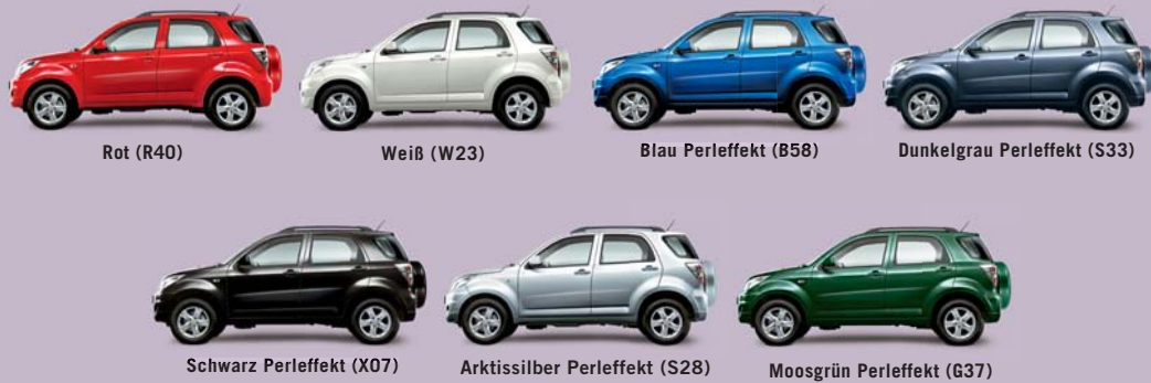
Abb. zeigen Terios Top 4WD.